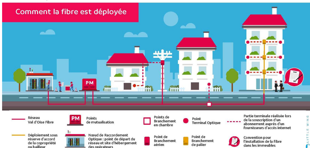
Schéma de déploiement de la fibre :

* Communes desservies par le NRO de Beaumont-sur-Oise sont : Beaumont-sur-Oise, Bernes-sur-Oise, Bruyère-sur-Oise, Champagne-sur-Oise, L'Isle Adam, Mours, Nointel, Noisy-sur-Oise, Parmain, Persan, Presles, Ronquerolles, Valmondois.